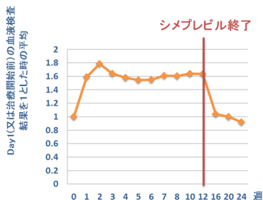
グラフ1 総ビリルビン値

総ビリルビン上昇は43例(60.7%)認められた。総ビリルビン値はシメプレビル開始直後から上昇し、シメプレビル終了後に低下した(グラフ1)